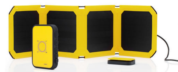
WakaWaka SolarPannel+ Power5